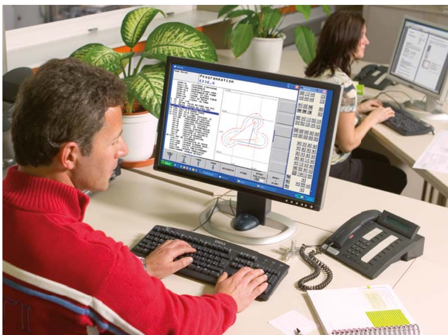
Stazione di programmazione con tastiera virtuale