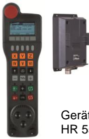
Geräte-Kombination HR 550FS und HRA 551FS

Bitte beachten Sie deshalb nebenstehendes „ Vorgehen im Servicefall “.